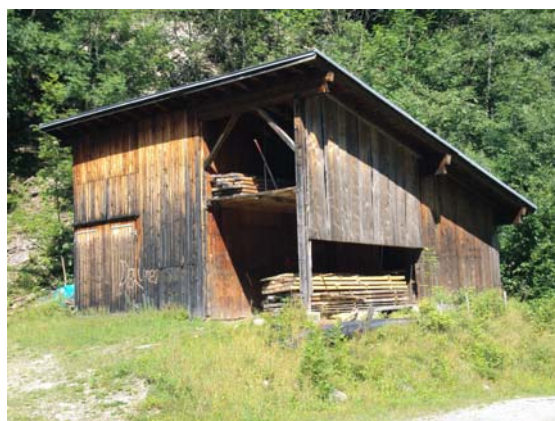
magasin a Vaulas