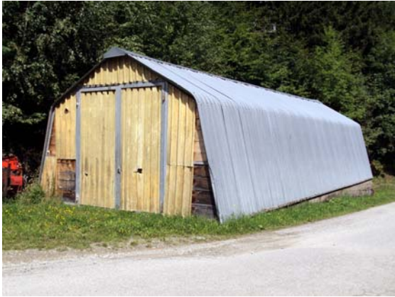
magasin a Miralv