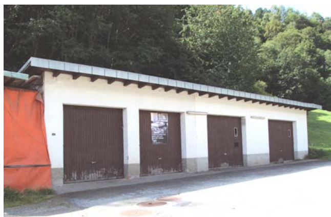
garaschas a Giachentrina

la via veglia dalla Val Sumvitg els Barschous, il baghetg dall'antieriura pendiculara a Vaulas sco era il tshaler dil schurmetg civil en casa da scola a Surrein sco magasins pil forestalessers. Quella situaziun spatitschada da maschinas, material, indrezs ed uaffens ei fetg malpratica e caschuna surmesira cuosts da transports. Tut quels viadis da dislocaziun drovan era bia temps che savess vegnir duvraus pli effizient.