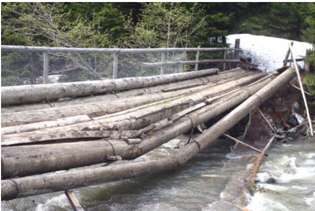
punt dils Clavaus avon e suenter

Las grondas nevasas digl unviern vargau han denter auter era caschunau gronds donnos vid punts e piogns da lenn en nosa vischnaunca. Aschia ein la punt dils Clavaus cun ina lunghezia da 21.0 m e la punt da Vigliuz cun ina lunghezia da 18.0 m vegnidas reconstruidas da niev. Tier la punt sut la staziun da Rabius ei il vial che era gia pulitamein sils onns vegnius remplazzaus. Quellas lavurs ein vegnidas exequidas dalla gruppa forestala sut la direcziun dil selvicultur. Il passadi sur il dargun da Falens, che era vegnius devastaus entras la malaura dils 17 da fenadur 2009, ei vegnius reconstruius dus dis pli tard dalla gruppa stradala, aschia che la via da velos ei stada serrada mo cuort.