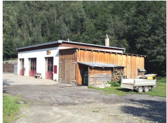
baghetg ad Igniu

Il scaldament existent cun barschader d'ieli e tanc vegn mi-daus ora cun ina pegna da zenslas cun in magasin adequat. Per quei scaldament niev sto il baghetg existent vegnir engrondius da vart encunter notg. Las zenslas vegnan tenor pusseivladad manizzadas ord lenna da nos uauls.