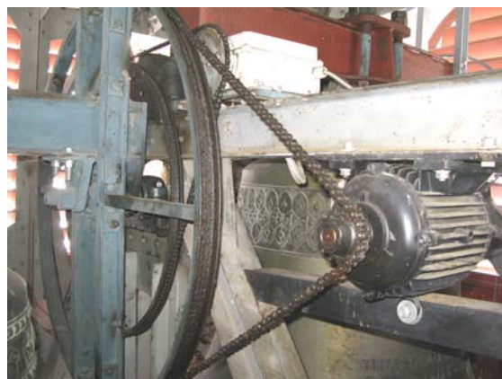
tracziun zenn nr. 3