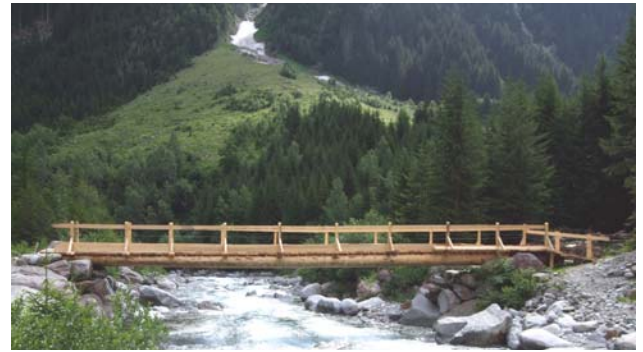
nova punt da Vigliuz