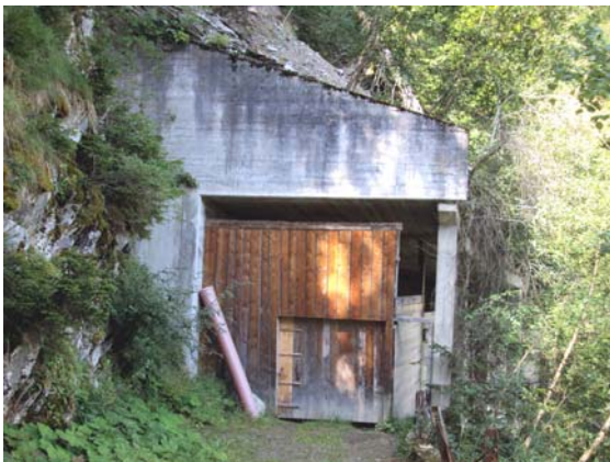
magasin a Baraschaus

Malgrad tut quels differents baghetgs dat ei buc in da quels ch'adempless las pretensiuns minimalas d'in menaschi adequat pil forestalesser. Era maunca in pign luvratori scaldau, nua che reparaturas e servis da resgias ed uaffens sa vegnir fatgs durant dis da freid e plievgia. La situaziun dall'infrastructura forestala ei pia tut auter che buna per adempir bein las multifaras lavurs forestalas, sco era ils ulteriurs pensums che la gruppa forestala exequescha per nosa vischnaunca.