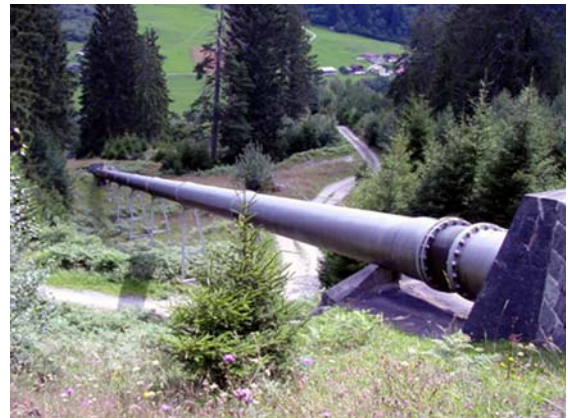
lingia da pressiu

Il temps da concessiun ei lu vegnius fixaus sin 80 onns. Il di d'entschatta dalla concessiun ei staus igl 1. da fenadur 1947, il di che l'ovra Russein ei vegnida messa en funcziun ed ha per l'emprema gada furniu electricitad per l'industria da dr. Oswald. La concessiun croda pia ils 30 da zercladur 2027.