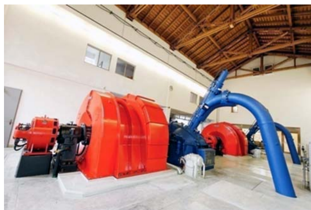
centrala Russein cun turbinas e generaturs

La lescha dil dretg dallas auas preveda en art. 48 era la puseivladad dad in retuorn a tschep avon la scadenza regulara dalla concessiun. En in tal cass tschontschan ins dad in "retuorn a tschep avon temps". In tal agir vegn prius lu en consideraziun, sch'in'ovra duei per exempel vegnir baghegiada ora. L'iniziativa vegn per regla dall'ovra sezza, el cass da Russein dalla Hydro Surselva AG. Mintga vischnaunca concessiunara sco era il cantun ston dar lur consentiment ad ina concessiun nova. Per che las vischnauncas sappien prender las decisiuns corrispundentas, basegna ei denton extendidas lavurs da preparaziun.