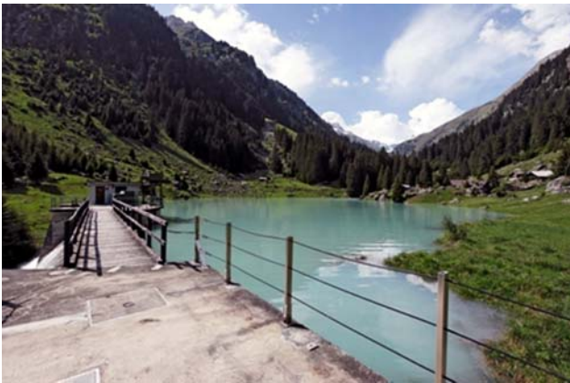
lag da fermada Barcuns

Dapi 1947 furnescha l'ovra hidraulica Russein energia schubra, energia regenerabla. In studi dalla Hydro Surselva AG, la proprietaria dall'ovra Russein, muossa che la produczion indigena d'energia regenerabla sa vegnir optimada e che quella gida aschia essenzialmeins da segirar il provediment cun energia electrica.