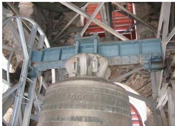
giuv zenn grond

Sin Numnasontga duei il tuchiez da Sumvitg lu puspei tunar sco adina giud clutger.