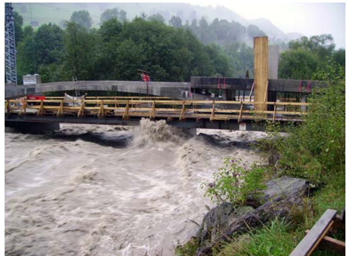
(punt Gonda en sanaziun cun aua gronda dils 07-09-2008)

naunca che sto bugen ni nuidis vegnir purtaus.