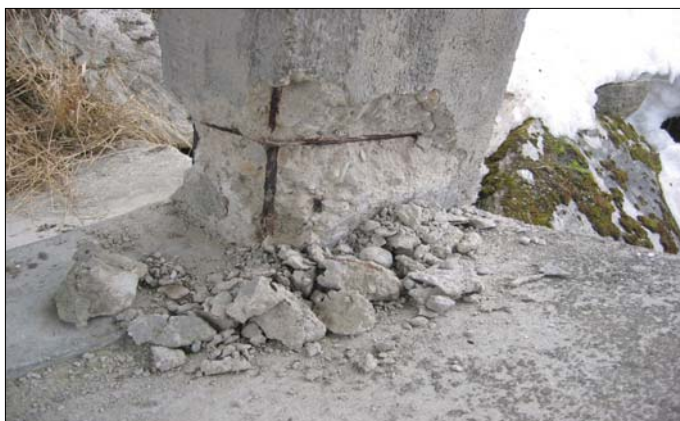
in dils numerus donns vid la Punt Gonda

Il quen d'investiziun dat ina survesta dils projects previ per 2006. Il gudogn brut da 387'900 frs. prognosticaus per 2006 el quen current lubess alla vischnaunca da far investiziuns nettas da rodund 550'000 frs. per buca carschentar sur mesira il deivet. Ils projects approvai che vegnan actualmein realisai sco la sanaziun dalla via dalla Val Sumvitg e la sanaziun dil plaz scola a Sumvitg ston vegnir terminai. Era stuein saver realisar novs projects pli pigns, denton buca meins impurtonts, che possibiliteschan in bien prosperar da nossa vischnaunca. Egl avegnir stuein plinavon quintar cun pli grondas investiziuns el manteniment da nossa immensa reit da vias.