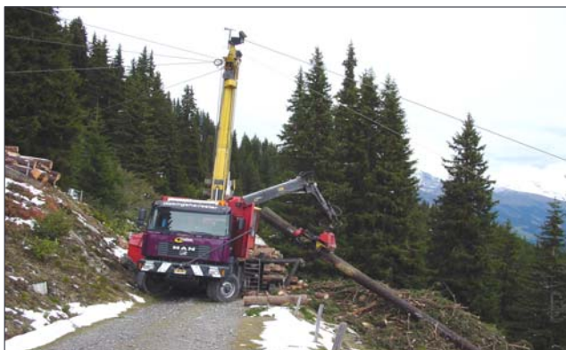
maschina da trer lenna sin suga, per sromar e resgiar si

Suenter liungas ed intensivass discussiuns strategicas pertuccont igl avegnir dil forestalessers da nossa vischnaunca ed en vesta allas finamiras da "lenna renda" ha la suprastanza communal decidu d'inizialisar ina collaboraziun pli stretga cun l'interpresa forestala Candinas SA. Ina tala collaboraziun cun la firma indigena ha per finamira d'optimar l'economisaziun digl uaul, da reducir ils cuosts tier la raccolta da lenna ed aschia contonscher ils megliers pusseivels prezis en favur dil quen forestal. La collaboraziun vegn reglada en fuorma d'in contract da consorzi, nua che pensums, obligaziuns e dretgs ein stipulai claramain. Cundiziun indispensabla per il bein reussir da quella collaboraziun ei ina calculaziun dallas lavurs cun trasparenza absoluta dils facturs da calculaziun. Demai che scadina calculaziun sto la finala vegnir approbada entras il selvicultur da revier ei ina optimala trasparenza che fuorma la finala la basa necessaria per la confidanza denter ils partenaris garantida. Ton il selvicultur da revier sco era il representant dalla firma Candinas SA ein responsabels persuenter.