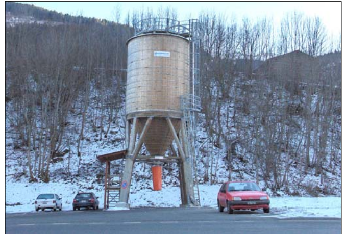
silò existent a Zignau (niev silò, da medema grondezia!)

Cun quei silo sa il sal che vegn duvraus durant igl unviern vegnir cumpraus en gia la stad per in prezi pli favoreivels, aschia ch'il prezi total dil sal (incl. amortisaziun dil silo e.a.v.) vegn egl avegnir ad esser pli bass ch'il prezi che las vischnauncas pagan oz al cantun.