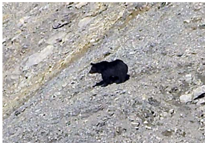
Uors JJ2 sin viadi el Grischun