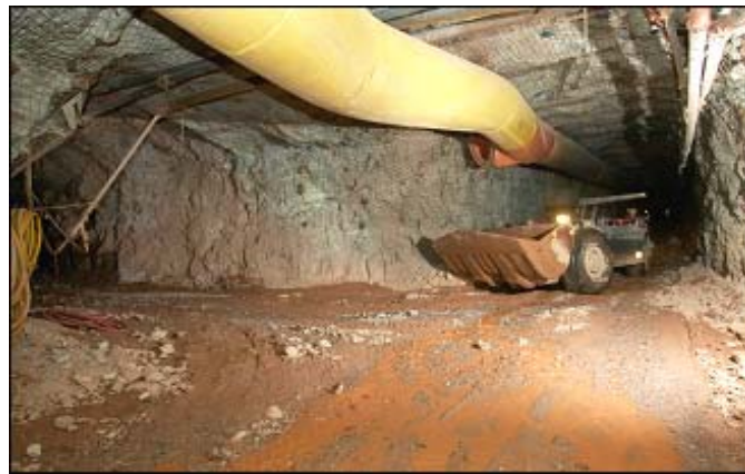
Gallaria ella miniera d'aur a Pinos Altos el Mexico

legala per ina eventuala explotaziun digl aur en nosa vischnaunca. In'explotaziun ei gie mo lu realisabla sche la rentabilitad dad ina miniera ei dada e sche tuttas pretensiuns davart dil schurmetg da natira ed ambient san vegnir adempridas. Aschia duei, tenor meini dalla suprastanza communal, buca la munconza dalla basa legala esser il crap da scarpetsch per la realisaziun d'ina miniera dad aur ellas vischnauncas pertuccadas, mobein las suranumnadas raschuns.