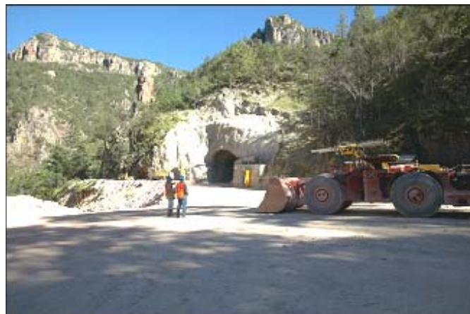
Miniera d'aur a Pinos Altos el Mexico

Sin fundament dils resultats dall'exploraziun vegn la MinAlp SA a decider, schebein ina "exploziun" ei economica e duei vegnir persequitada vinavon ni buc.