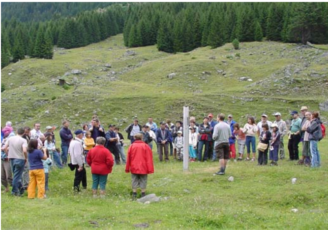
inauguraziun dalla senda da detgas

persuenter a tuts in sincer engraziel fetg! Quels dis vegn la senda da praulas e detgas presentada en la gasetta „Schweizer Familie“ ed aschia fatga enconuschenta ad in vast publicum ell'entira Svizra.