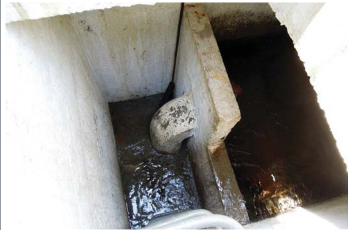
La stiva d'aua existenta a Murtès

La stiva d'aua existenta a Murtès che rimna tut l'aua tschaffada en las singulas fontaunas ei construïda ord betun.