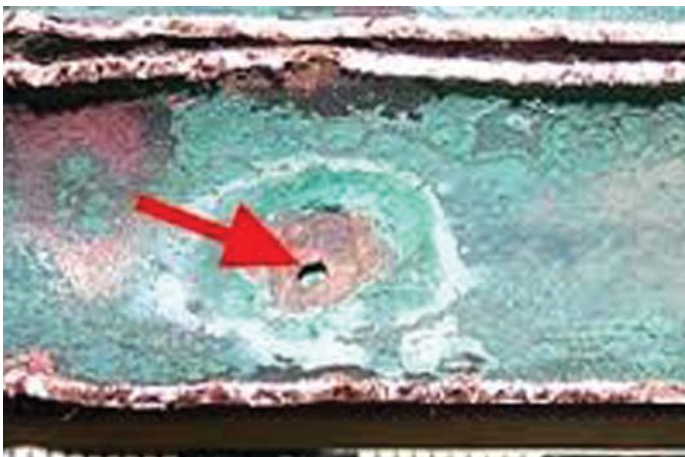
Aschia san ils donns vid las lingias da pressiun veser ora

Vid quellas lingias ch'ins ha stuiu remplazzar ein ils donns fetg bein veseivels e per part alarmonts. Lingias cun pintgas ed era pli grondas ruosnas da corrosiun dattan in maletg general sur dil stan dallas lingias da pressiun. Igl ei da supponer che sin l'entira reit va gia ussa in grond quantum aua mintga di a piarder.