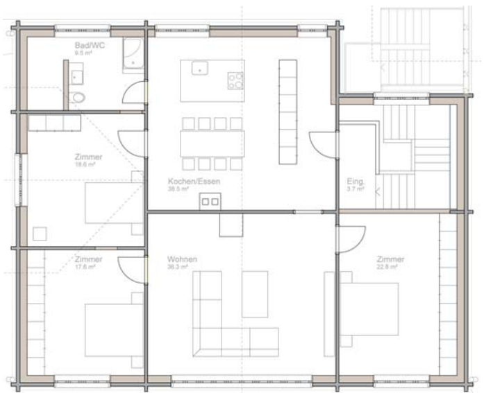
plau sut il tetg

Muort l'abdicaziun dils affittaders ein las duas alzadas suren actualmein vitas. La suprastonza communal ha ord quei motiv persequitau pliras variantas davart il ventur diever da quellas localitads. Gia tier la sanaziun egl onn 2002 ei l'opziun da far habitaziuns vegnida discussiunada e per part era giavischada. Tenor il meini dalla suprastonza communal duei la part el plaunterren vinavon star a disposiziun per il vitg e per la vischnaunca sco era per occurrenzas privatas. En las alzadas suren ei previu, sch'igl interess ei avon maun, da baghegiar duas habitaziuns. La finamira ei da saver porscher a famiglias in suttetg cun ambient famigliar en in liug ruasseivel per cundiziuns raschuneivlas. Adina puspei semuossa la situaziun che famiglias ch'enqueran in suttetg en nossa vischnaunca anflan buc in tal ed ein aschia sfurzadas d'encurir in habitadi en las vischnauncas vischinontas.