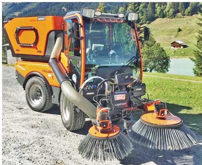
La maschina Holder S130 cun ils indrezs da schubergiar vias