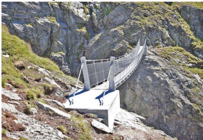
Exempel d'ina punt pendent dil gener da Nepal

Previu ei ina punt tenor il principi da punts pendentas da Nepal. La funcziun da purtar sorprendan quater sugas purtontas da 26.4 millimeters. Da mintga vart dalla punt vegn construui fundaments da betun. La passarella consista da stuors surzinau dil tip Serrated . La lunghezia dalla punt munta 57 meters.