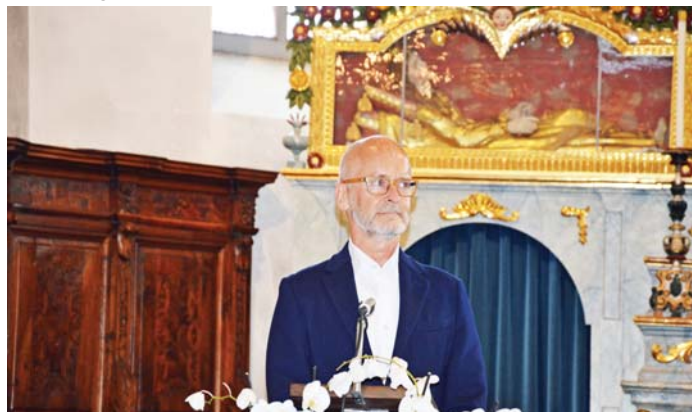
ambassadur Timo Rajakangas

La primavera 2020 ha Pauli Immonen contactau la vischnaunca da Sumvitg cul giavisch d'organisar ina commemoraziun a caschun dils 100 onns dapi quei eveniment. Ils representants dalla vischnaunca da Sumvitg enconuschevan buca la historia digl accident han denton mussau grond interess d'organisar ina cerimonia ensemen culla delegaziun finlandesa. En ina emprema scuntrada han ils representants dalla vischnaunca da Sumvitg e dalla Pleiv Sumvitg beneventau ils 29 da matg 2020 Pauli Immonen e g'ambassadur finlandes per la Svizra ed il Principadi da Liechtenstein. Tier quella sentupada ha Pauli Immonen ch'ei sez pilot explicau detagliadamein la historia digl accident. Immonen ei sefatschentaus da rudien cugl accident ed ei dil meini ch'ei settracta buca d'ina sabotascha aschia sco ei stat scret els cudischs da historia. Sco pilot enconuscha el las sfidas da surmuntar las Alps cun in aviun. Risguardond il fatg ch'igl aviun cumpraus ell'Italia possedeveva aunc negina tecnica moderna per navigar eis ei pli probabel stau in accident senza influenza externa. Motivau d'organisar ina cerimonia ha oravontut il fatg ch'ei settracta tier il litinent Durchman d'in frar da sia tatta. En ina simpatica sentupada han Pauli Immonen, igl ambassadur Timo Rajakangas , ils representants dalla vischnaunca da Sumvitg ed ils representants dalla Pleiv Sumvitg concludiu d'organisar comunablamein in act commemorativ e tschentar a Barcuns sper il lag ina tabla vid in crapun.