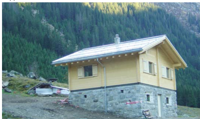
Tegia Val Tenigia

Independent dils cuosts restonts pli favoreivels basegna il project in credit supplementar ed ina decisiun dil gremi cumpetent. Tenor art. 30 al. 2 b) dalla costituziun communal ei la radunonza communal il gremi cumpetent per decider davart il credit supplementar da 32'000 francs. Ord quei motiv damonda la suprastanza communal la radunonza communal per il credit supplementar.