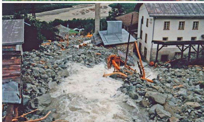
Auas grondas igl onn 1987

Dapi 1900 ha la Val Luven procurau quater gadas per auas grondas e procurau aschia per donns. Quei ei succediu 1920, 1928, 1954 ed igl onn 1987. Igl onn 1954 ha l'aua fatg donns als rempars. Tier ils eveniments ein duas gadas il quartier da Luven (1920 e 1987) staus pertuccaus e treis gadas il quartier da Curtins (1920, 1927 e 1987).