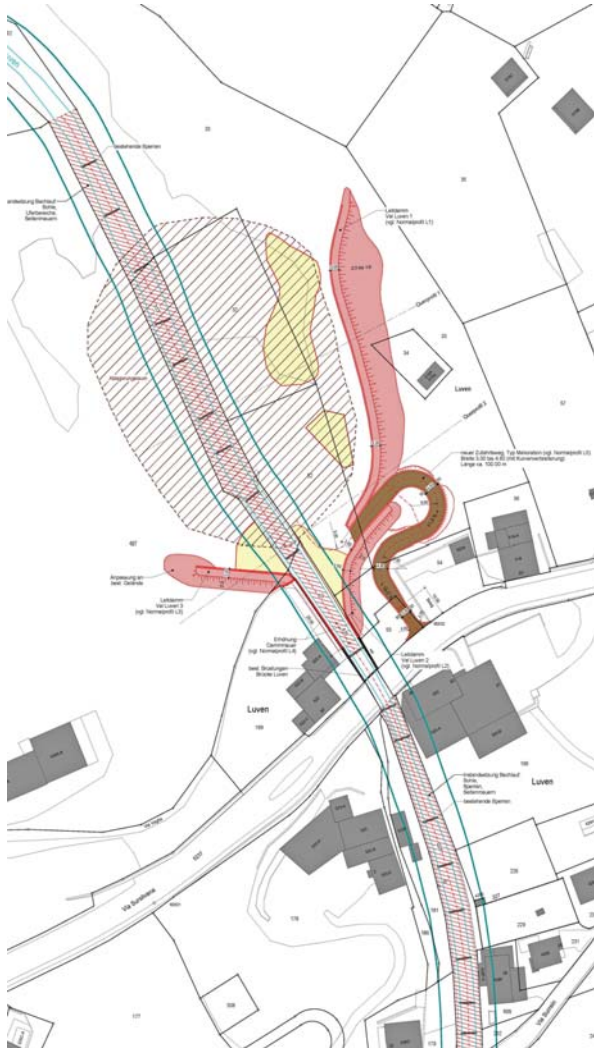
Schurmetg dallas auas a Luven

Igl ual da Luven sa tier auas grondas ir surora gest sur la via cantunala sut Prau Liung. Il rumper ora d'in ual selvadi sa tier in eveniment d'aua gronda buca vegnir impediud. Ord quei motiv sto il material vegnir tenius si per aschia evitar donns tier las casas vischinontas. L'aua duei tuttina saver flessegiar anavos egl ual. Ella Val Luven vegn perquei construui treis rempars da deviazion. Quels treis rempars dueien impedir inundaziuns el territori da Luven e menar l'aua anavos egl ual avon che las auas cun material penetreschan giu ella via cantunala. Il potenzial da deposit da material avon ils rempars planisai vegn schazegiaus denter 5000 e 7000 m 3 .