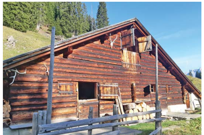
Stalla alp Valesa Sut

Igl onn 2009 ha la vischnaunca da Sumvitg schau vi 17 da sias tegias e stanzas d'alp che vegnan buca duvradas dalla corporaziun d'alps Sumvitg per l'alpeggiun ni ch'ei occupadas dalla fumeiglia d'alp mo per in cuort temps d'ora. Ils contracts da fittaziun culs locaturs da quell'as immobilias prevedan in temps da locaziun da 10 onns e cuoran ora culla fin digl onn 2019. La suprastanza communal vul era egl avegnir affittar las tegias e scriva ora las tegias per la proxima perioda l'entschatta schaner 2020. Avon che scriver ora las tegias ei la suprastanza communal sefatschentada cun las cundiziuns per sclarir schebein ei bagegna zanza adattaziuns. Sin fundament d'ina analisa minuiziusa ei la suprastanza communal dil meini ch'ina midada dil temps d'affittaziun ei necessaria.