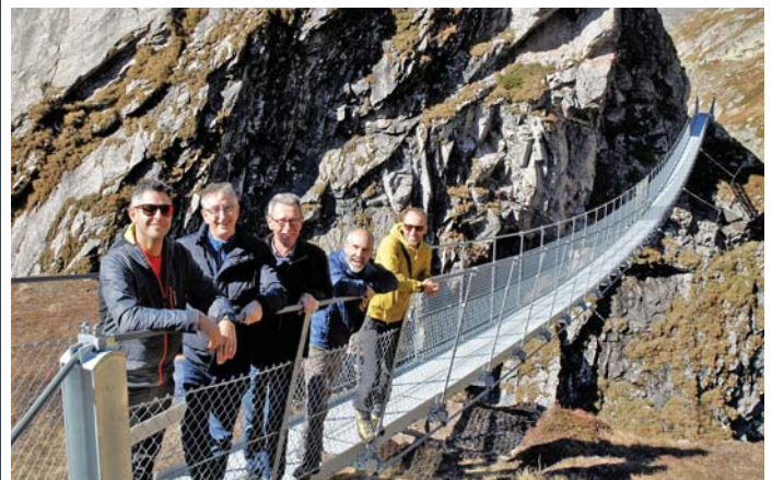
Punt Greina cun personas involvadas