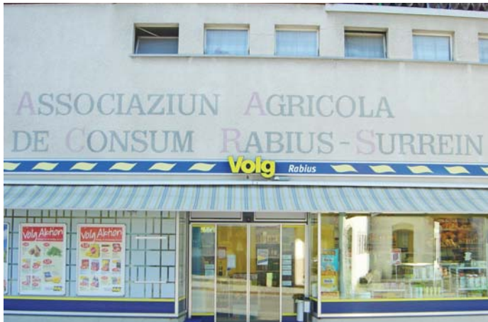
stizun dil Volg a Rabius

La stad 2019 ei la suprastonza dil Volg danovamein sedrizzata tier la vischnaunca cun la supplica per in agid. Tenor explicaziuns dils responsabels ha ei dau el decuors dils davos onns grondas midadas tier il persunal e la suprastonza dalla societad. Ils novs responsabels han constatau ch'il conto current era entochen la fin digl onn 2018 puspei s'augmentaus considerablamein. El decuors digl onn current han els denton anflau ed introduciu mesiras per reducir quei deivet. Quellas mesiras han purtau fretg ed il Volg ha saviu enteifer in onn reducir considerablamein il deivet tier la Fenaco. El mument cumbatta il Volg denton cun duas auras sfidas.