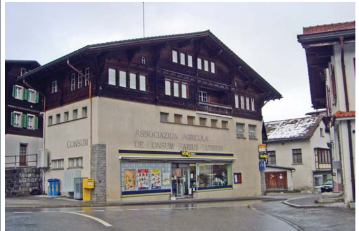
immobila dil Volg

La secunda sfida ei il baghetg nr. 492 sin la parcella nr. 217 a Rabius en il qual la stizun sesanfla. Il baghetg ei en possess dalla societad. Sin il baghetg ein actualme in hipoteca dalla banca da 265'000 francs ed igl emprest dalla vischnaunca da 150'000 francs. Quell'immobilia pretenda ils proxims onns grondas investiziuns. La situaziun finanziara dalla societad lai denton buca tier investiziuns.