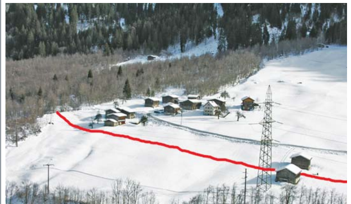
Trassé a Pardomat Dado

La varianta da cumpromiss perschada la gronda part dils involvai. Per la vischnaunca ei la varianta ina buna e segira sligiazion, per Nordic Surselva ed igl uffeci per la natira ed ambient in bien cumpromiss. La varianta preveda da menar la loipa naven da Plaun Petschen agl ur dalla parcella nr. 6352 tochen sin altezia dalla stalla da convischin Paul Mathiuet. Silsuenter duei la loipa vegnir menada atras igl uaul entochen sin la via da Falens - Pardomat. Allora vegen la loipa menada parallel cun la via da Falens - Pardomat.