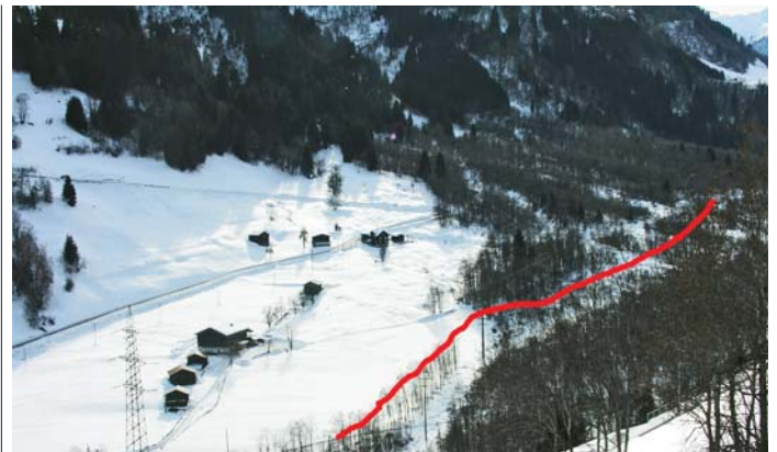
Niev trassé a Falens

Ils 8 da fevrer 2018 ha giu liug il secund test. A caschun da quei secund test era fetg bia neiv avon maun e relaziuns optimalas. La loipa da test han ins saviu preparar tenor la topografia ideala e tenor giavisch. Mo la differenza d'altezia da 50 m ch'ins sto surmuntar san ins buca encurir ora. Per igl uffeci per la natira ed ambient era quei la sligiazion giavischada. Mo cun intervegnir e perschader dalla problematica dil fagugn, la munconza da neiv e schaltira ei igl uffeci per la natira ed igl ambient staus prompts per in cumpromiss.