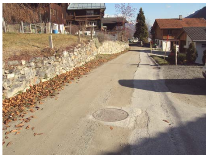
via Fonauna Sut

Il preventiv muossa ora investiziuns nettas da 1'422'980 francs, quei tier in cash-flow da 1'161'150 francs. Il cash-flow che muossa il gudogn avon las amortisaziuns indichescha la summa che stat a disposiziun per investiziuns nettas senza carschentar il deivet. Las cefras dil preventiv 2010 pretendan pia in augment dil deivet da rodund 261'830.