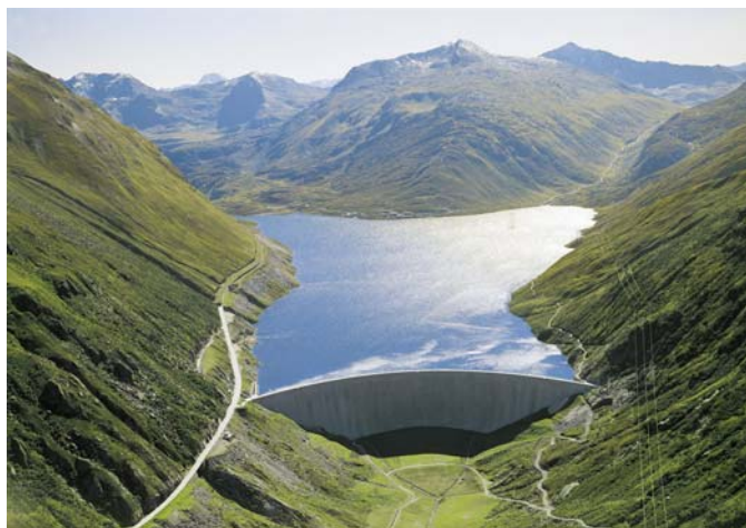
lag da fermada s. Maria

La consequenza da quell'adattaziun dil tscheins d'aua munta per nossa vischnaunca buca mo in beinvegniu alzament dallas entradas tiels tscheins d'aua, mobein era in alzament dall'indemnisaziun per la Greina.