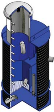
combra d'aua nova

Il project niev preveda da tschaffar las duas fontaunas en ina combra d'aua. Ord la combra d'aua vegn l'aua menada en in resevuar niev pli gronds (10 m 3 ). Naven da leu succeda il transport dall'aua en la lingia existenta che meina giu els baghetgs.