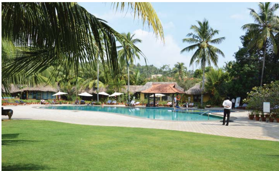
Il marcau principal da Kerala ei Trivandrum. Cheu havein nus passentau ils emprems quater dis da nies viadi en in hotel che schai gest allas rivas dalla mar.

Malgrad tut quei havein nus passentau ils emprems quater dis en in grondius hotel gest sper la mar, gudian las massaschas da Ayurveda, astgau guder il ruau sper il bogn aviert e visitau il marcau da Trivandrum. Sin nossas empremas aventuras havein nus adina puspei saviu constatar che pompusas rihezias e gronda paupradad sebrattan in sper l'auto a moda fetg extrema.