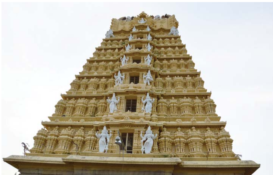
Il tempel da Chamundis Hills ei in liug che tila di per di biars pelegrins digl entir mund. Quel sesanfla sin ina muntogna sur il grond marcau da Mysore.

Ils 22 da november ei nies viadi ius alla fin. Nus essan sgulai naven da piazza aviatica da Bangalore via Dubai viers Turitg. Staunchels, denton cun massa regurdientschas e bia muments fetg emoziunals, essan returnai a casa.