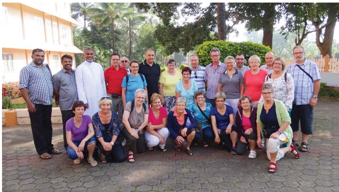
Gruppa dils pelegrins (fotograf Walter Deplazes maunca sin la foto)

Engraziel fetg sur Benny per quei grondius viadi.