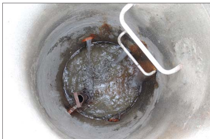
combra d'auo existenta

Igl aquaduct existent ell'alp Naustgel vegn spisgentaus cun duas fontaunas. Las duas combras dad auo ein baghegiadas fetg sempel cun tscherchels da betun cun in uvierchel da gus. Sin la fotografia dalla combra d'auo sutvart ei veseivel ch'auo entra en la combra d'auo e quei dall'empunadira dils tscherchels da betun tiel scalem giudem dretg.