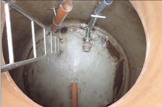
reservuar pign existent

Il resevuar pign (5 m 3 ) ch'ei baghegiaus cun celluloid rinforzau cun fibra da veider ei donnegiaus el funs. Dil mument ch'il resevuar ei vits vegn tal tschuffergnaus cun aua e buglia ch'entra. Quei ei bein veseivel sin la fotografia sutvart. Da quei mument ein las pretensiuns da higiena per aua da beiber sco era per la cascharia buca ademplidas. Ord quei motiv ston las combras dad aua sco era il resevuar vegnir sanai.