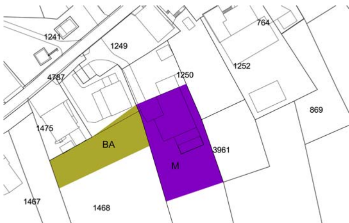
plan da situaziun cun zona da mistregn (M) e zona per baghetgs e stabiliments annex (BA)

El medem liug giavischa era la pleiv da Surrein ina midada dalla zona per ina part dalla parcella nr. 1468 per aschia possibilitar allas parcelas cunfinontas da nezegiar il terren dalla pleiv sco curtin ed iert ed era per saver construir leu ev. cassetas da curtin. Actualmein ei quella parcella ella zona d'agricultura nua che scadin diever buca agricol ei exlaus. Ord quei motiv damonda la pleiv da Surrein da midar 683 m 2 dalla parcella nr. 1468 dalla zona d'agricultura ella zona per baghetgs e stabiliments annex.