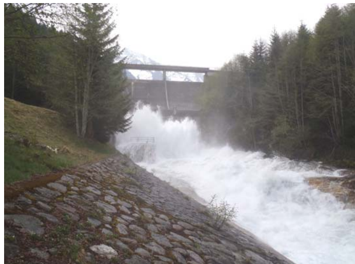
32 m 3 /s sorteschon dil lag tras la svidada da funs

Igl experiment ha mussau con ditg ch'ins sto spetgar cun arver si diltut la stola da deviazion, suenter ch'ins ha schau liber l'aua da signal per che persunas che sesanflan el vau dil Rein hagien avunda temps da fugir. Per far quels experiments che ein era vegni accumpignai dil surveglader da pesca han ins duvrau buca meins che 160'000 m 3 aua. Ils resultats da quei experiment vegnan integrai el reglament da menaschi dall'ovra e procuran aschia per in augment dalla segirtad per tut quels che sesanflan ina gada ni l'otra el vau dil Rein da Sumvitg.