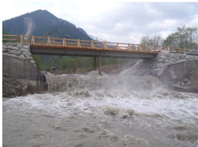
ca. 32 m 3 /s a Cahuonz

Igl experiment ha mussau con ditg ch'ins sto spetgar cun arver si diltut la stola da deviazion, suenter ch'ins ha schau liber l'aua da signal per che persunas che sesanflan el vau dil Rein hagien avunda temps da fugir. Per far quels experiments che ein era vegni accumpignai dil surveglader da pesca han ins duvrau buca meins che 160'000 m 3 aua. Ils resultats da quei experiment vegnan integrai el reglament da menaschi dall'ovra e procuran aschia per in augment dalla segirtad per tut quels che sesanflan ina gada ni l'otra el vau dil Rein da Sumvitg.