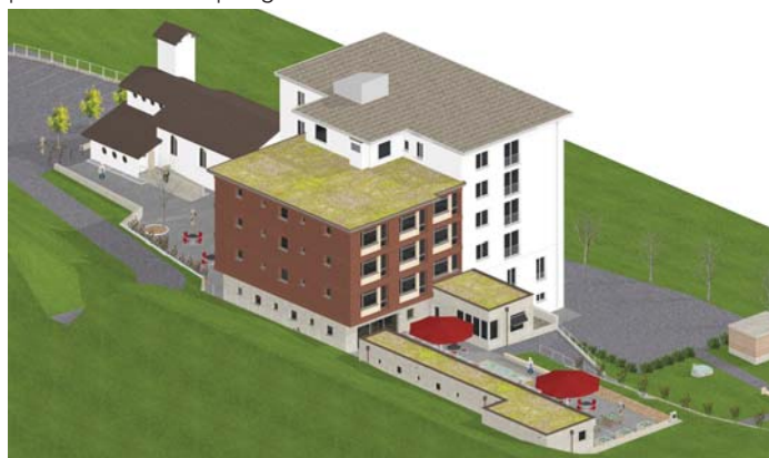
Visualisaziun Casa s. Giusep suenter terminaziun dil project

Ella part dil baghetg pli stgira sur la cafetaria vegness mintgamai construïu per etascha quater combras singulas cun duscha e tualetta. Plinavon vegness scaffiu plazs cun ina bun'atmosfera per setener si en pintgas cuminonzas.