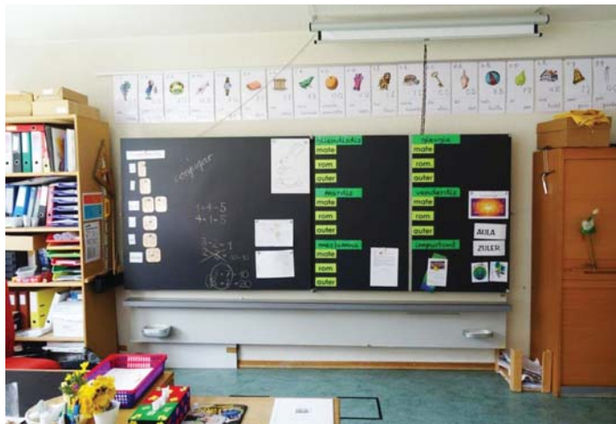
Ina tabla veglia dalla casa da scola da Rabius

Denter tschun e sis tablas ston vegnir allontanadas. Entginas vegnir allontanadas nua che l'escha da colligiaziun ei planisada e per part ston las tablas vegnir midadas damai ch'ellas ein brava-mein en decadenza. Per quei intent savein nus duvrar las tablas dalla scola da Sumvitg.