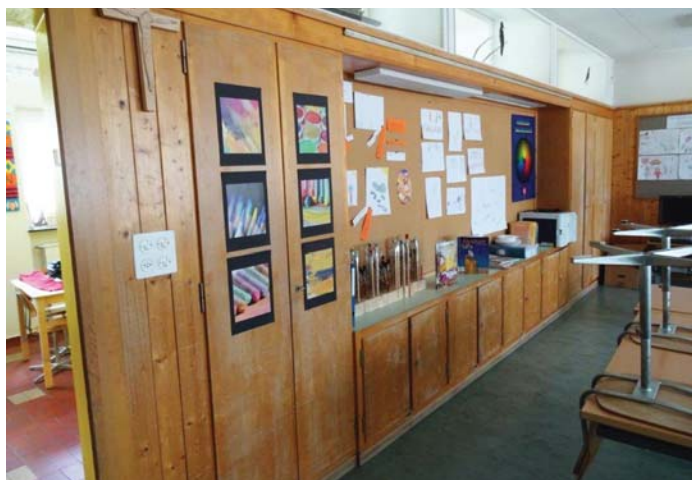
Las scaffas basegnan ina restauraziun

Las scaffas en stanzas da scola ein en in schliet stan. Ellas vegnan restauradas, per part midau siaras che funcziuneschan buca pli e frestgentau la colur. Medemamein basegna l'escha da vegnir tractada.