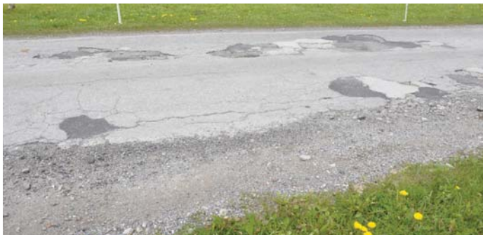
La part dalla via da Reits tochen tier la Punt Gonda ei en in miserabel stan

Actualmein ei igl Uffeci da construcziun bassa dil cantun Grischun lundervi da sanar cumpletamein la part dalla via cantunala atras il vitg da Surrein. Tochen sin las vacanzas da stad la fin da fenadur duessan quellas lavurs esser terminadas. Tenor il plan general d'avertura dil traffic finescha la part dalla via che sauda al cantun sin l'altezia dalla caplutta da Reits. Naven da quella tochen tier la Punt Gonda ei la via classificada sco via communal da rimnada. Quella part dalla via ei gia dapi plirs onns en in fetg schliet stan. Manteniment parzial ei uss strusch pli pusseivel ed ei mintgamai mo da cuort cuoz. A vesta dalla sanaziun totala dalla via cantunala atras Surrein tochen a Reits ei ussa era la vischnaunca en l'obligaziun da metter en uorden siu tschancun dalla via. Per saver far quei ha la suprastanza communal incaricau il biro d'inschignier Depalzes da Surrein da preparar in project.