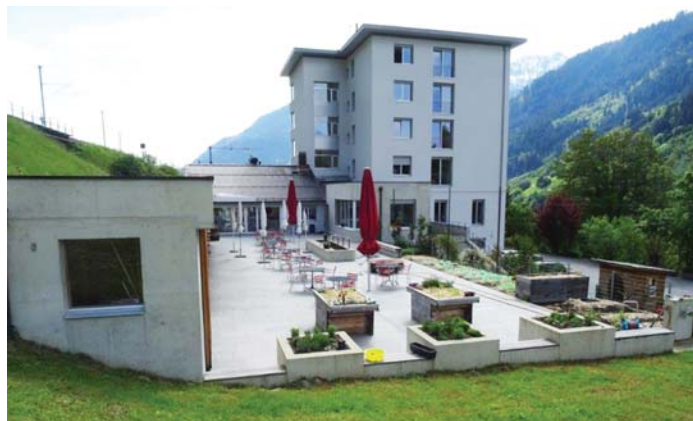
Casa sogn Giusep

Varga 100 onns porscha la casa plazzas da lavur en differentas funcziuns per persunas dalla vischnaunca da Sumvitg e contuorn. Els davos 5 onns ha la casa purschiu 30 plazzas da lavur cumpleinas, ella media han 55 – 60 persunas indigenas anflau lavur en la Casa sogn Giusep. Sper quellas plazzas vegn purschiu plazzas d'emprendissadi, da practicum e per fuffergnadis sco era plazzas da lavur ensemen cun l'assicuranza per invaliditad e cun la Casa Depuoz per aschia segidar cun persunas cun impediments e per puspei saver reintegrar quellas.