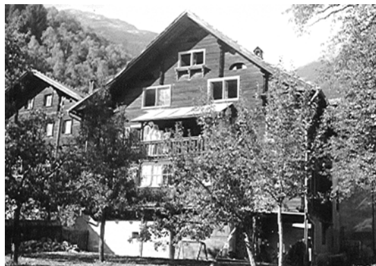
il "spital da 1889"

quistau igl onn 1889 la casa Bavier a Trun / Sum il Vitg e mess a disposiziun tala sco casa pauperila, il schinumnu "Spital".