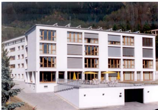
Casa s. Martin, project 1998

Ils dus purtaders dalla Casa s. Martin, la fundaziun Casa s. Martin e la corporaziun Casa da tgira Sutsassiala han 1996 entochen 1998 renovau ed engrondu il baghetg existent. Sin basa dil concept cantunal ei vegniu realisau ella Casa s. Martin 30 combras dublas e 6 combras singulas. Ell'alzada sisum digl anteriur baghetg han ins saviu realisar duas habitaziuns da mintgamai duas stanzas che ein dapi la realisaziun stadas occupadas tut il temps.