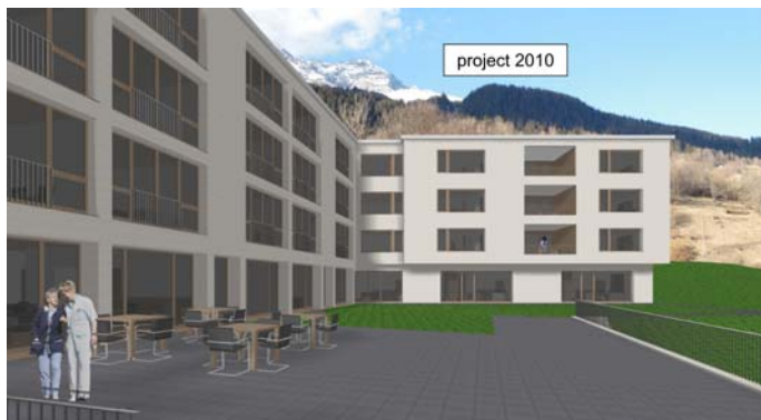
terrasa existenta cun vesta sin baghetg niv