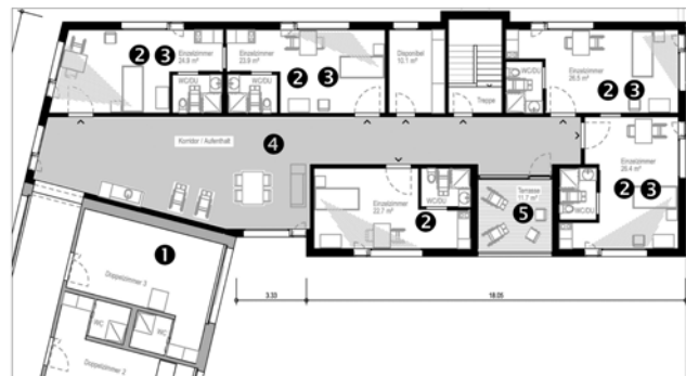
2., 3. e 4. alzada cun combras singulas

Las 10 stanzas dublas actualas en mintga alzada vegnan funcziunadas entuorn en combras singulas. Duas stanzas dublas, confortablas restan en mintga alzada. Il baghetg niev che ei colligiau directameins cul baghetg existent survegn tschun stanzas da tgira singulas per alzada.