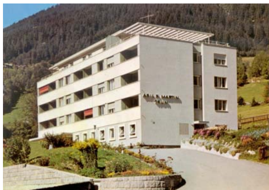
Asil s. Martin, project 1966

Els onns 1960, pia 70 onns pli tard, eran las relaziuns el "Spital" buca pli supportablas, aschia che la fundaziun Asil s. Martin ei vegnida fundada. La fundaziun ha lu baghegiu duront ils onns 1964-1966 in niev baghetg a Dulezi. Igl Asil s. Martin era l'emprima casa da vegls en Surselva cun ina partiziun da tgira. El purscheva plazs a 60 attempai e deva lavur a 16 persunas.