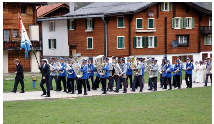
las duas musicas da Dumengi'alva a Surrein

Spanegiai eran nus tuts sils da Rabiuis. Semtgai ad uras cun in pign aperitiv, spitgavan nus sin ils novs. Suentar il sitg da beinvegni ed ina legra runda da presentaziun, essan nus tuts semess vid il sunar.