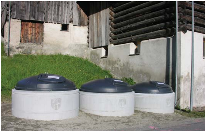
molocs a Cumpadials

A Cumpadials havein nus construì treis molocs, in per rumians da casa, in per veider ed in per cuppas.