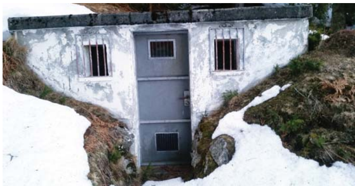
staziun da reducziun dalla pressiuin e da repartiziun a Surseivs

Circa 70 meters d'altezia sut la staziun a Murtès sesanfla la staziun da reducziun dalla pressiuin e da repartiziun a Surseivs . La lingia tier quella sesanfla ella via veglia da Crap Ner. En quei liug vegn, sco il num di gia, reduciu per l'emprema gada la pressiuin. Suenter vegn l'aua spartida ed ina lingia meina viers Clavadi – Cumpadials e l'autra lingia encunter Sogn Benedetg e Sumvitg. Encunter il meini d'enqualin, ei quella staziun buca in reservuar d'aua, mobein mo ina staziun da repartiziun. Quella sesanfla sur Siltginas Su, fetg giud via ed ei specialmein igl unviern mo malamein contonschibla. Tier disturbis da regulaziun ch'ei ha dau ils davos onns adina puspei en quei liug ein las lavurs necessarias leu adina stadas cumbinadas cun grondas stentas. Las apparatusas en quei local ein en in fetg schliet stan, fetg da ruina e mo per part en funcziun. La ligiadira sedistacca e smiula dallas preits. Suenter la renovaziun vegn era quella staziun da repartiziun buca pli duvrada e duei vegnir spazzada.