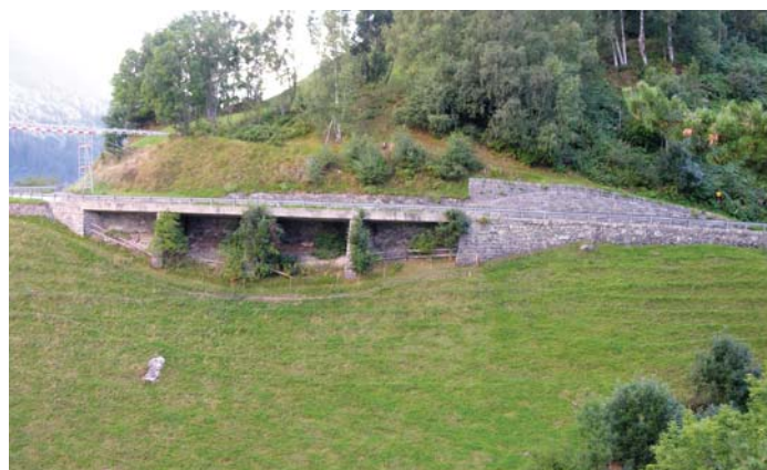
via existenta a Val Mulinaun

Suenter l'approbaziun dil preventiv 2017 ha la suprastonza communal persequitau vinavon il project ed incaricau il biro d'inschignier Cavigelli SA da Glion d'elaborar in project per la senda da viandar.