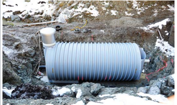
la nova combra d'aua a Murtès ei gia vegnida montada igl atun 2014

Per saver far las mesiraziuns necessarias en connex cun quella sanaziun, ei la combra d'aua a Murtès vegnida tschentada gia igl atun 2014. Quella consista ord in element finiu cun tut las apparaturas internas necessarias. Cun agid d'in helicopter special ei quei entir element vegnius tschentaus el foss preparaus persuentar. La combra ei 5.84 meters liunga, ha in diameter intern da 2.50 meters e peisa ca. 3250 kg. La combra ademplescha tut las pretensiuns dalla societad svizra da l'industria da gas e dallas auas (SVGW). La combra ei cun excepziun dall'entrada cumpletamein sut tiara.