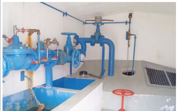
reservuar da Cumpadials

Ils reservuars da Sumvitg e Cumpadials ein vegni baghegiai ils medems onns ed han era la medema fuorma e la medema funcziun. Els han in volumen total da 150 m 3 , da quei ein 30 m 3 reserva da diever e 120 m 3 reserva da fiug. La combra rodonda da quels reservuars ha in diameter intern da 6.50 meters ed in'altezia da diever da ca. 4.50 meters. La construcziun da betun da quels dus reservuars ei aunc en fetg bien stan. Tenor las enconuschientschas actualas san ins quintar che quellas combbras piardan buca au a e san suenter ina sanaziun sil stan tecnic hodiern vegnir duvradas vinavon. Ella combra cullas apparatusas da regulaziun ein ils mirs naven dalla primavera entochen igl atun fetg humids. Tut las apparatusas sezzas ein varga 50 onns veglias, funcziuneschan mo per part e ston vegnir remplazzadas complettamein. Igl onn vargau ei aunc vegniu fatg ina urgenta revisiun dallas ventilas per insumma saver garantir il provediment ordinari els vitgs da Sumvitg e da Cumpadials ed era per segirar las funcziuns necessarias en cass d'in incendi en quels loghens.