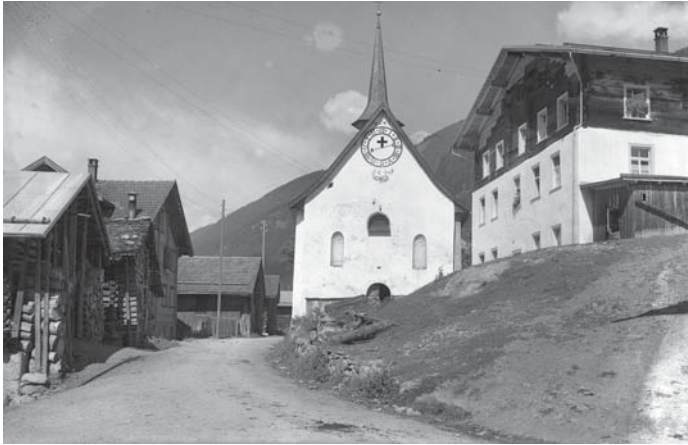
caplutta da Cumpadials

lavor e pil material per deponer las archivalias ed ils documents ellas scatlas d'archiv. La pagina d'internet www.archivcultural-sumvitg.ch dat ina detagliada investa egl archiv cultural da Sumvitg. L'essenziala lavur che stat ordavon a tut auter ei il rimnar. Sin la pagina ein gia entginas fotografias veglias dil mintgadi da temps gia daditg vargai disponiblas. Las fotografias en quella contribuziun ein mo in pign schatg dalla rihezia culturala digl archiv.