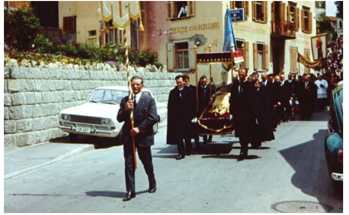
processiun da Sogn Mudest a Sumvitg

definitiv e dar el agl archiv. Tgi che vul sa directamein purtar siu uorden egl archiv cultural a Surrein sunter haver contactau ina dallas persunas en suprastonza. Aschia san ins era gest prender investa da quei liug nua ch'igl uorden vegn lu archivaus. L'uniun ei engrazievla per mintga archivalia ed engrazia cordialmein en num da tuts che sestentan per in archiv cultural interessant e da rihezia culturala pigl avegnir.