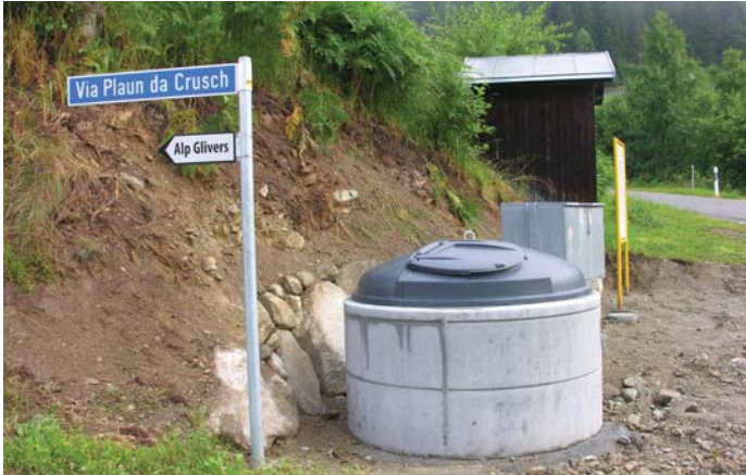
moloc a Plaun da Crusch

Ella vischnaunca da Sumvitg eis ei vegniu montau ils davos dus onns molocs en differents loghens. Aschia ha ei dapi in onn a Plaun da Crusch in moloc per rumians da casa.